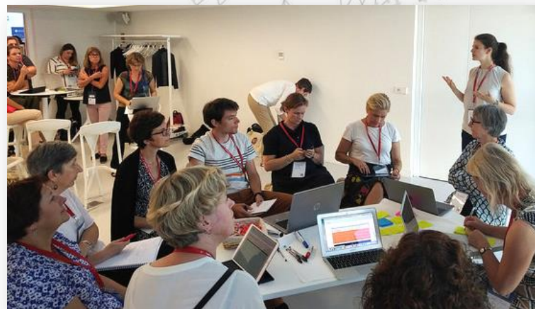
Workshop du Digital Skills for Library Staff and Researchers Working Group avec Foster+ (2018).

https://www.leru.org/news/open-science-and-its-role-in-universities-a-roadmap-for-cultural-change